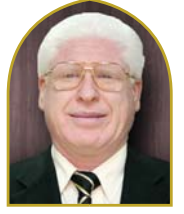
د. عز الدين بن زغبة نائب رئيس هيئة الرقابة الشرعية بنك السلام الجزائر و عضو لجنة دبي التابعة لـ "الأيوبي" الإمارات